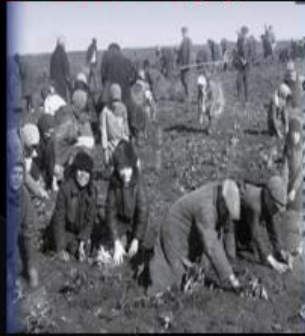
люди в пошуках їжі...