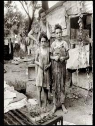
залишилися без хліба і хати